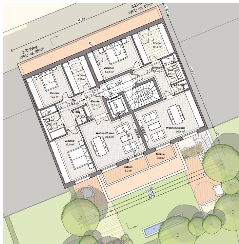
Ifd. NR. 07.2 - GRUNDRISS 3. OBERGESCHOSS - 1:100

Alle Angaben zum Bauvorhaben stammen von den Bietern