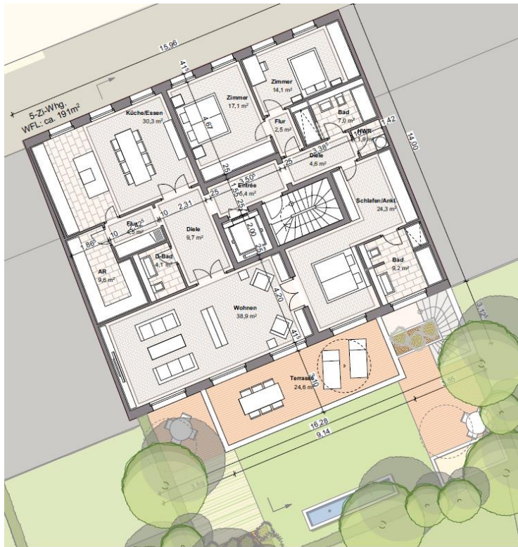
Ifd. NR. 07.1 - GRUNDRISS 2. OBERGESCHOSS - 1:100