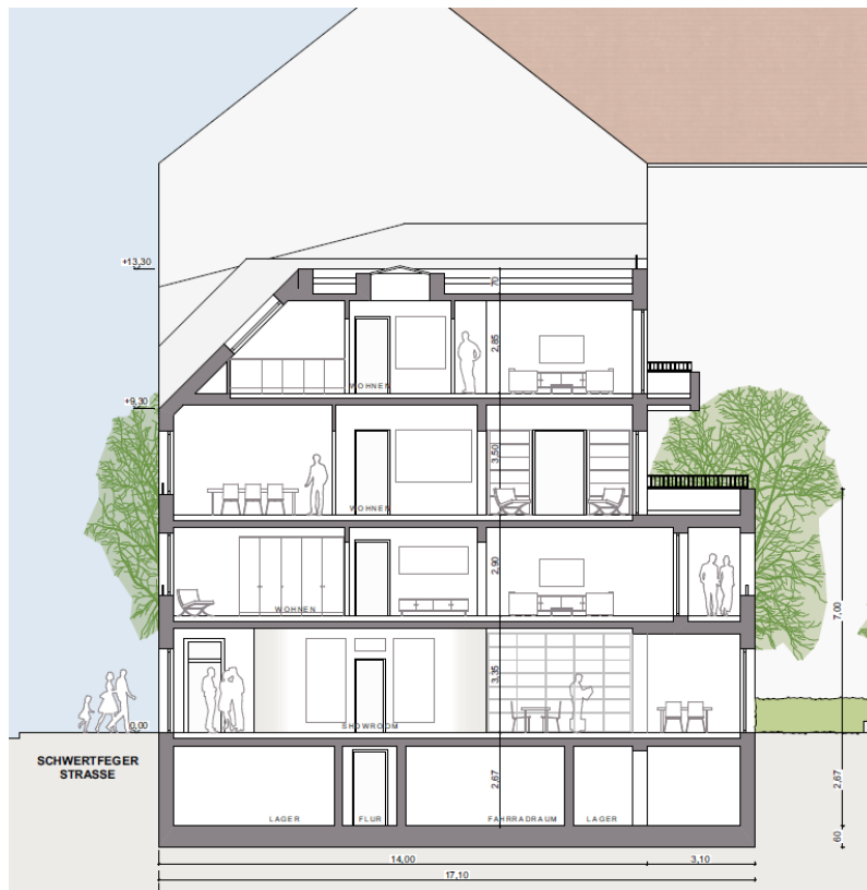
Ifd. NR. 09.0 - LÄNGSSCHNITT - 1:100