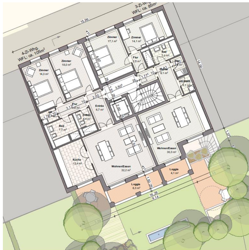
Ifd. NR. 07.0 - GRUNDRISS 1. OBERGESCHOSS - 1:100

Alle Angaben zum Bauvorhaben stammen von den Bietern