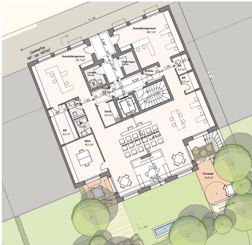
Ifd. NR. 06.0 - GRUNDRISS ERDGESCHOSS - 1:100