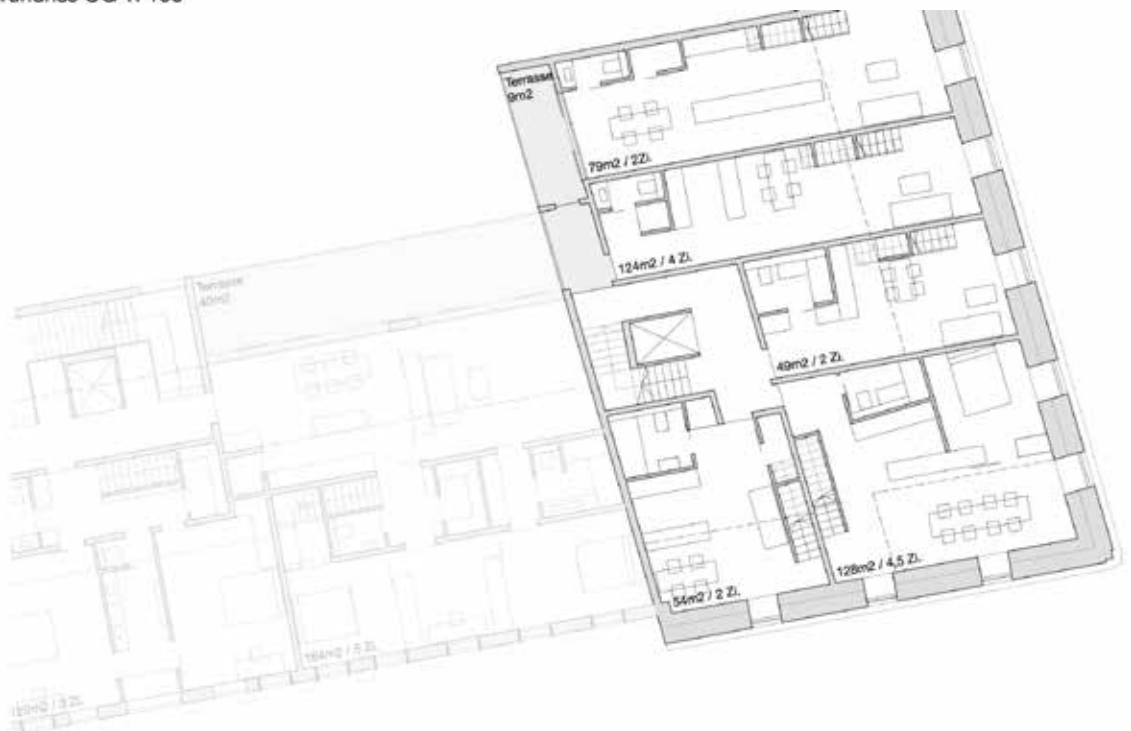
Grundriss DG 1: 100