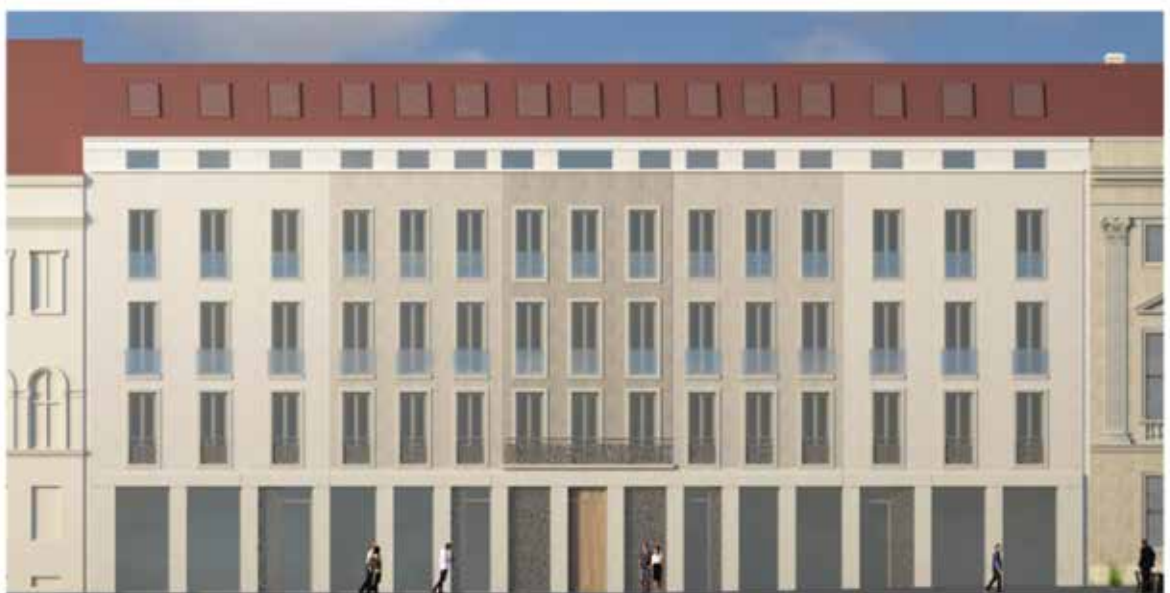
Straßenansicht 1: 100