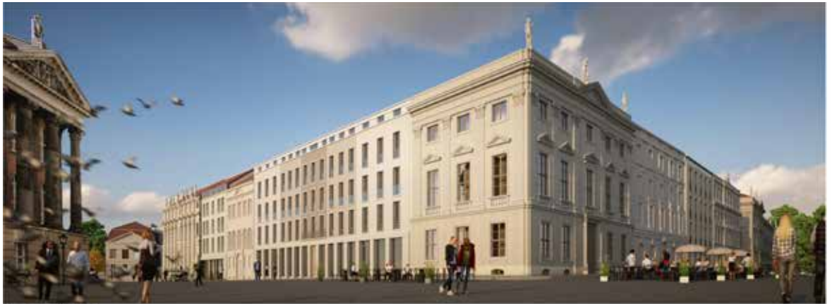
Perspektive Schloßstraße | Am Alten Markt