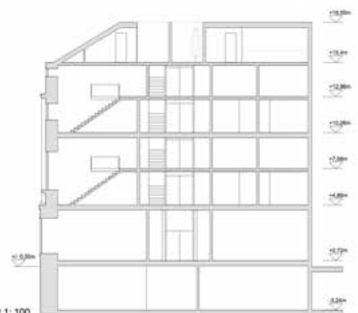
Längsschnitt 1: 100