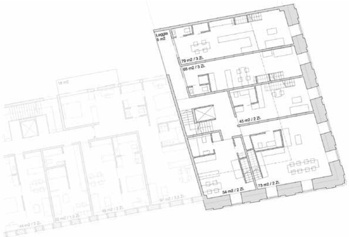
Grundriss OG 1: 100