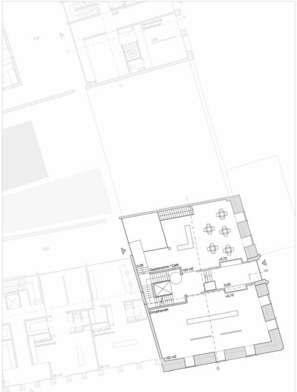
EG mit Außenbereich 1: 100