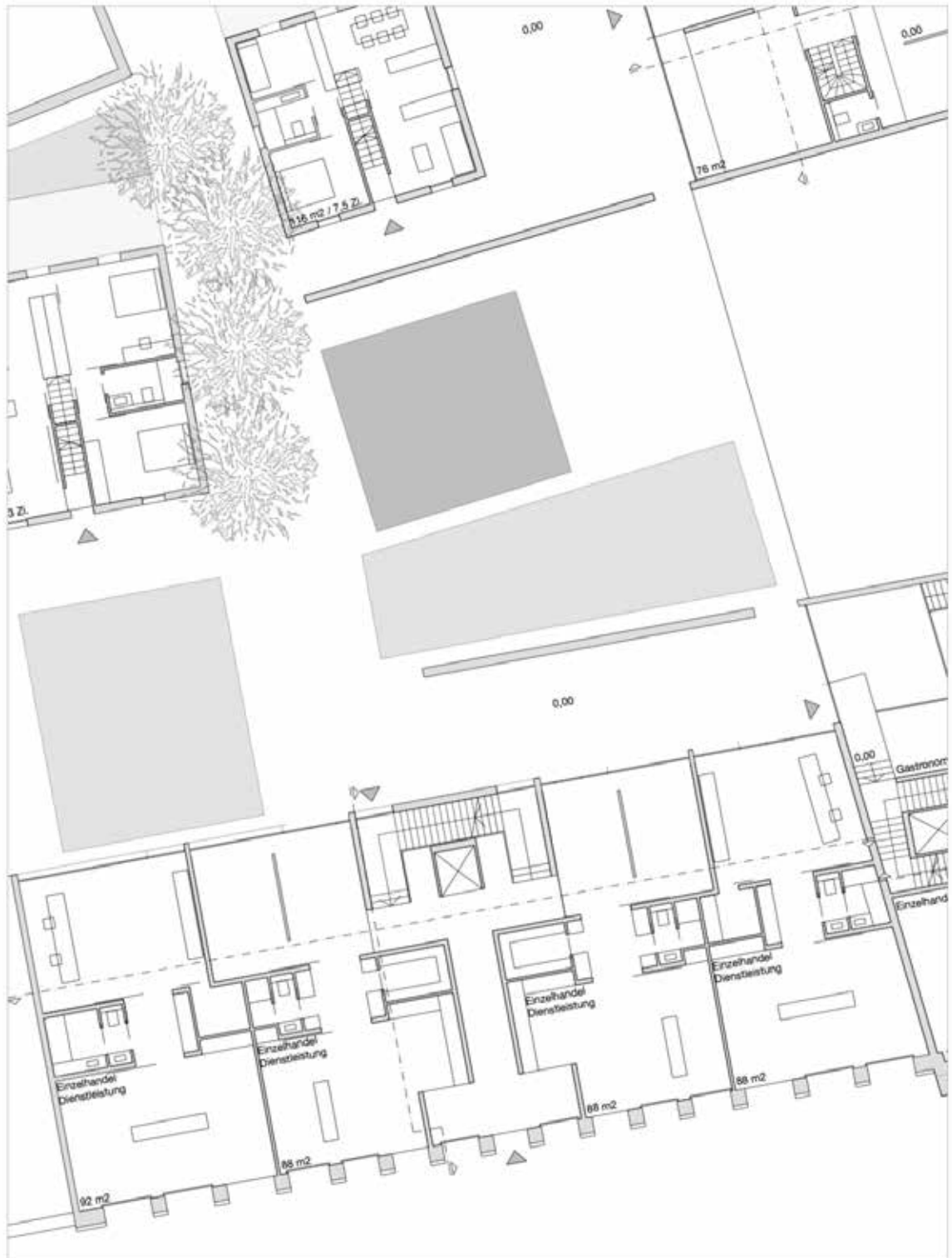
EG mit Außenbereich 1: 100

Alle Angaben zum Bauvorhaben stammen von den Bietern