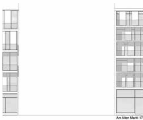
Hofansicht 1: 100