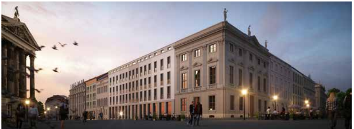
Perspektive Schloßstraße | Am Alten Markt