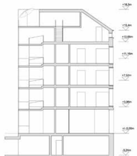
Querschnitt 1: 100

Alle Angaben zum Bauvorhaben stammen von den Bietern