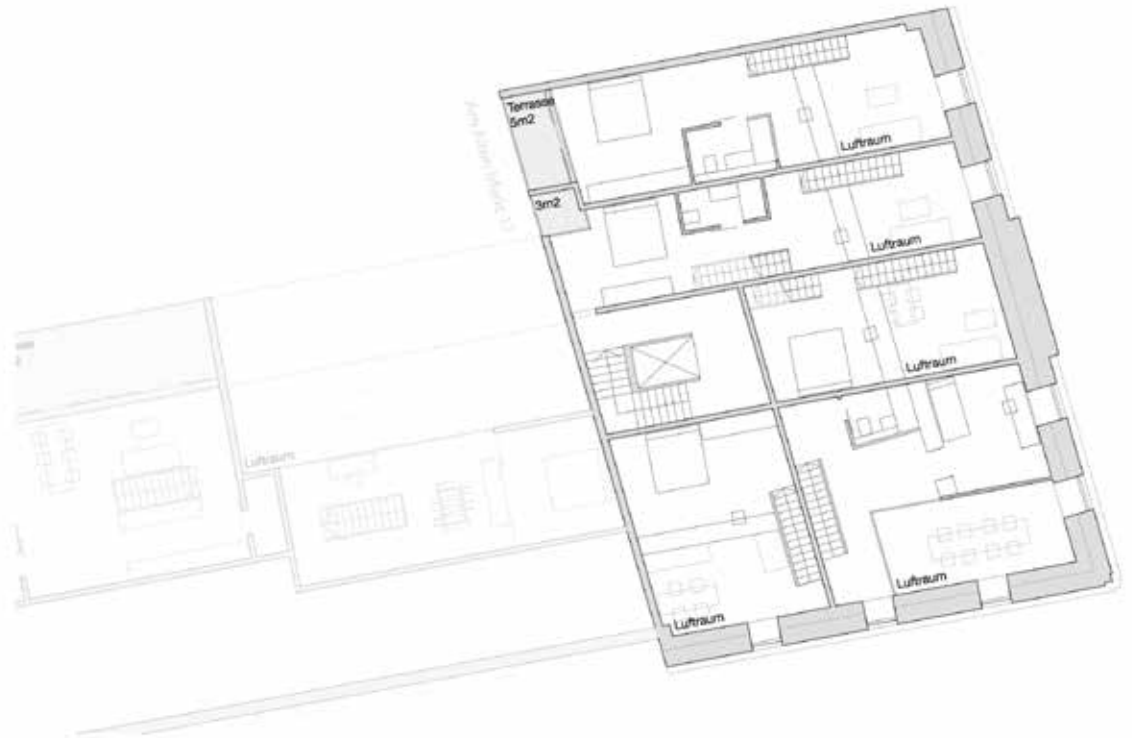
Grundriss DG Maisonette 1: 100