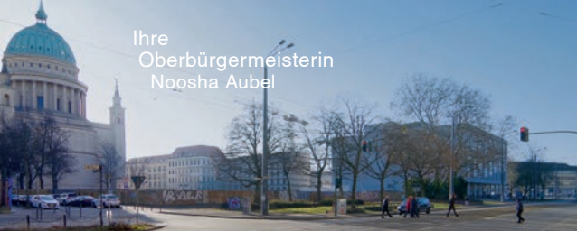
Karree am Alten Markt Baufeld Block V, Am Kanal ⑩ (ehem. Staudenhof) 01/2026

Unser Anspruch ist es, die vielfältigen Interessen in einen fairen Ausgleich zu bringen – im Dialog, mit Respekt vor unterschiedlichen Sichtweisen und mit dem Ziel, eine Mitte zu gestalten, die für viele Menschen ein Ort des Aufenthalts, der Begegnung und der Identifikation ist.