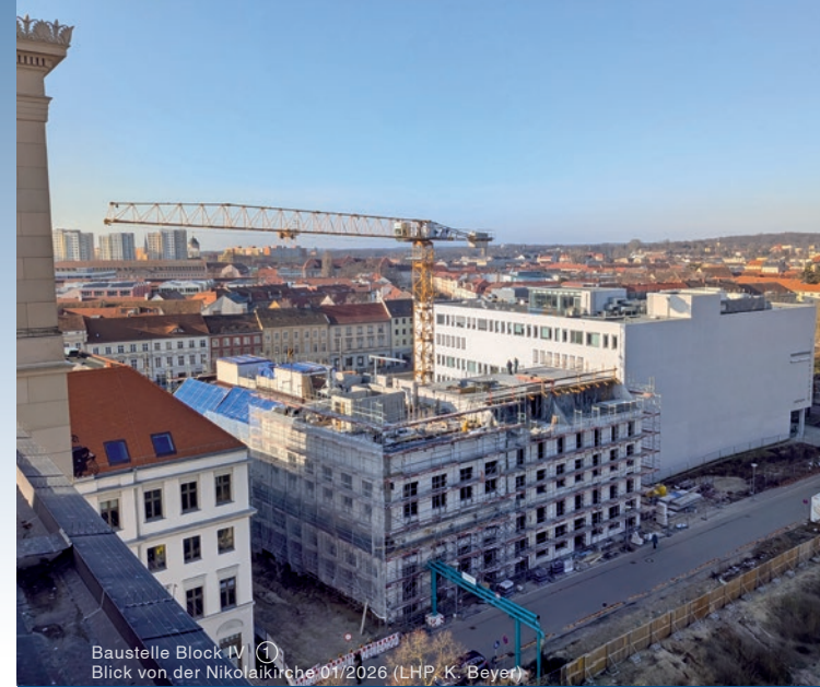
Baustelle Block IV Blick von der Nikolaikirche 01/2026

Die Wetterfahne, die den Abschluss des Turms bilden wird, steht bereits seit 2014 als originalgetreue Rekonstruktion in einer Schauvitrine an der Breiten Straße.