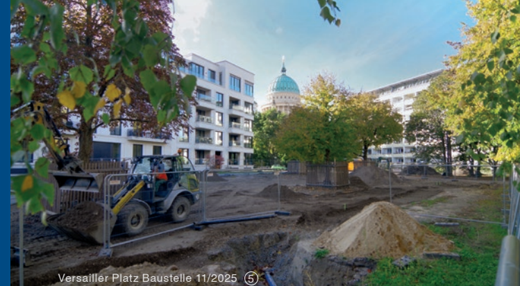
Versailler Platz Baustelle 11/2025 ⑤