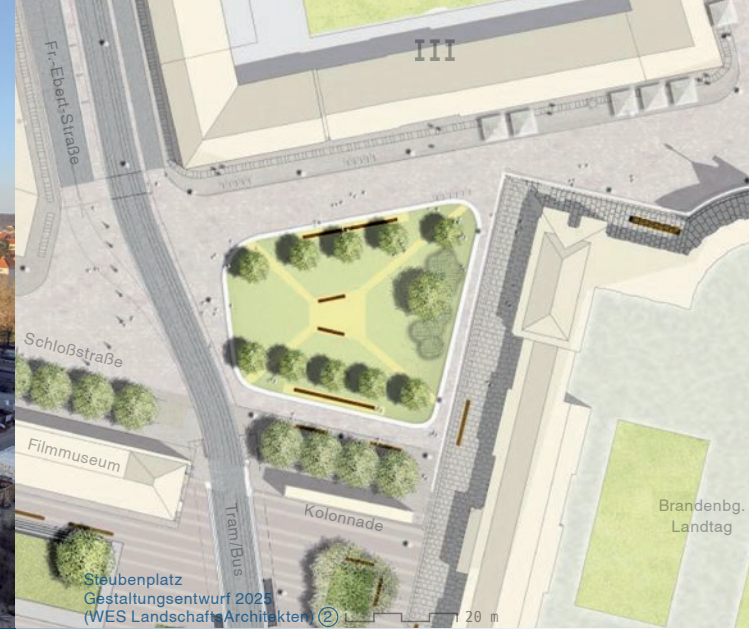
Steubenplatz Gestaltungsentwurf 2025 (WES Landschaftsarchitekten)