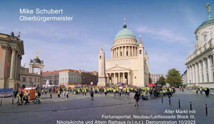
Alter Markt mit Fortunaportal, Neubau/Leitfassade Block III, Nikolaikirche und Altem Rathaus (v.l.n.r.), Demonstration 10/2023