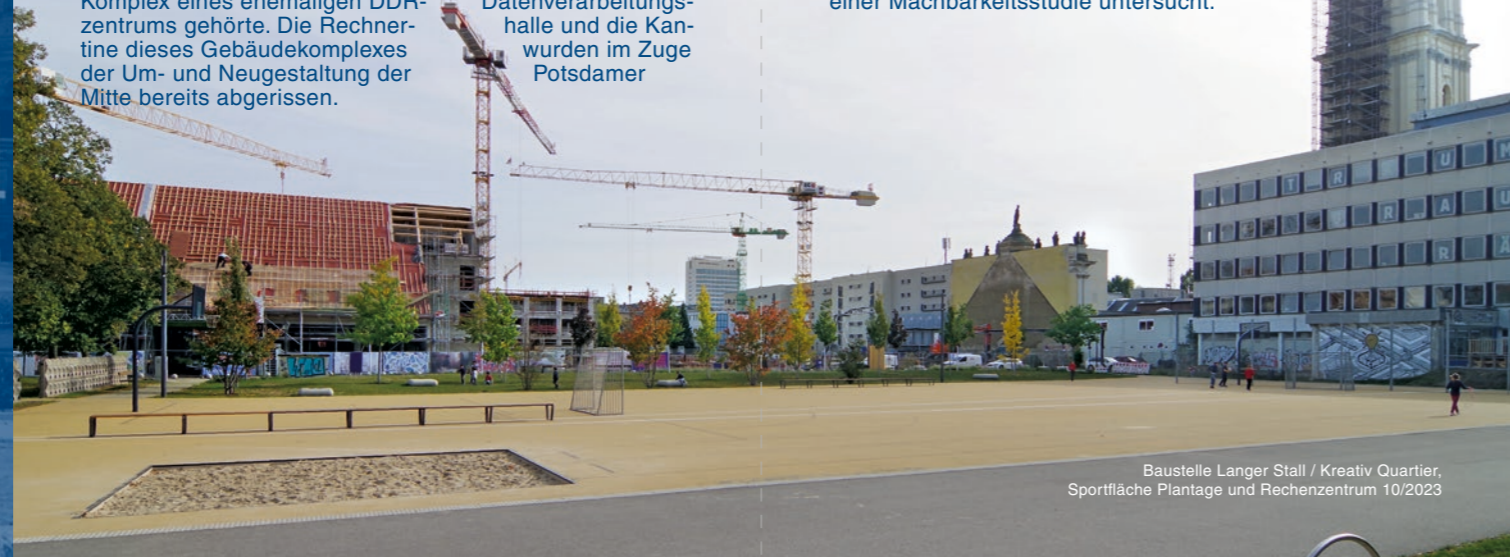
Baustelle Langer Stall / Kreativ Quartier, Sportfläche Plantage und Rechenzentrum 10/2023

In unmittelbarer Nachbarschaft zum wiedererrichteten Garnisonkirchturm und auf einem Teil des ehemaligen Kirchenschiffs steht das temporär bis 2025 als Kunst- und Kreativhaus genutzte „Rechenzentrum“, ein 1971 fertiggestellter Beton-Stahlskelettbau, welcher zu einem größeren Komplex eines ehemaligen DDR-Datenverarbeitungszentrums gehörte. Die Rechnerhalle und die Kantine dieses Gebäudekomplexes wurden im Zuge der Um- und Neugestaltung der Mitte bereits abgerissen.