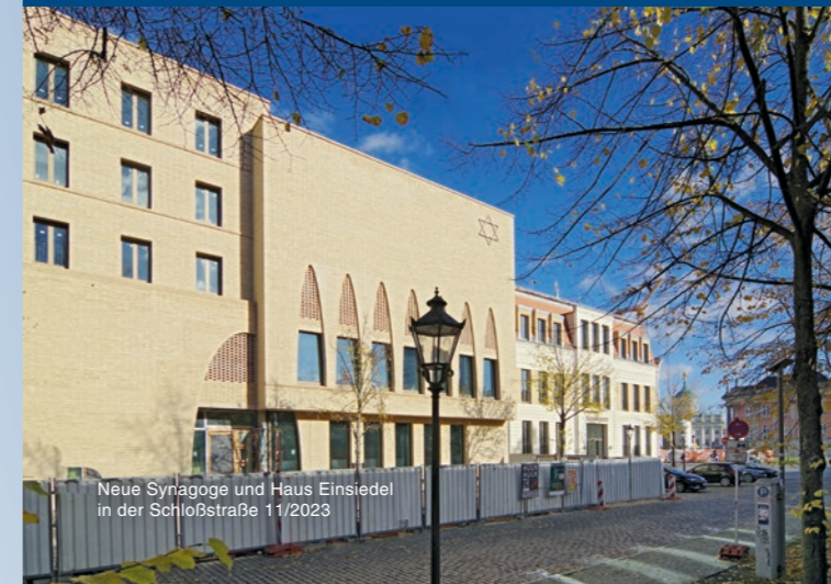
Neue Synagoge und Haus Einsiedel in der Schloßstraße 11/2023

Der Grundstein für den Neubau wurde am 8. November 2021 gelegt und am 26. August 2022 das Richtfest gefeiert. Ab dem Sommer 2024 öffnet die neue Synagoge ihre Türen.