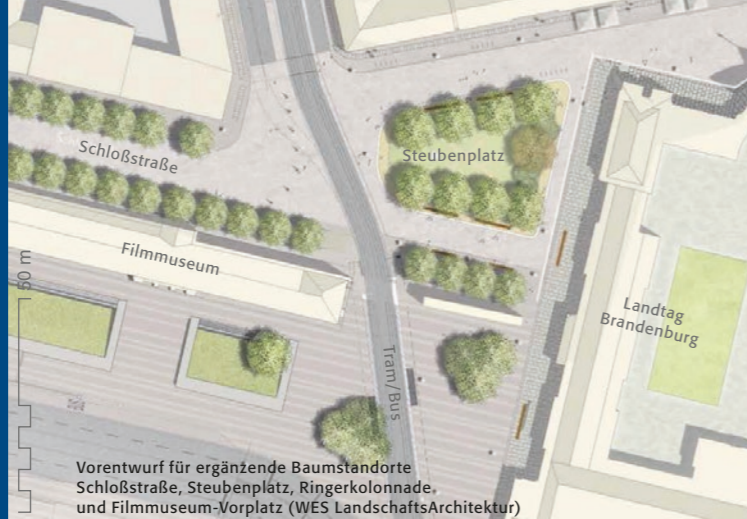
Vorentwurf für ergänzende Baumstandorte Schloßstraße, Steubenplatz, Ringerkolonnade, und Filmmuseum-Vorplatz (WES LandschaftsArchitektur)