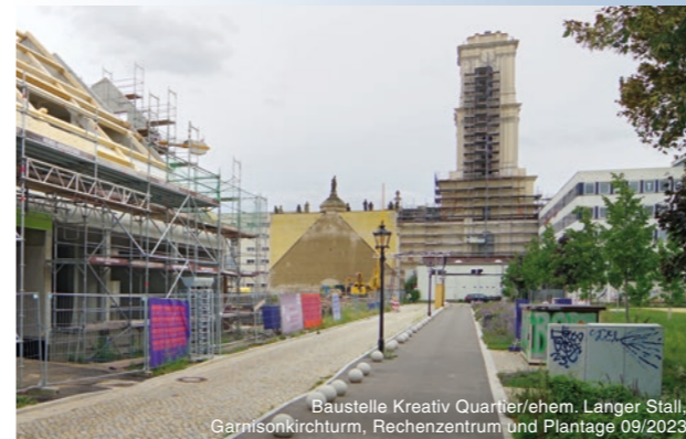
Baustelle Kreativ Quartier/ehem. Langer Stall, Garnisonkirchturm, Rechenzentrum und Plantage 09/2023

Die Stiftung Garnisonkirche Potsdam als Betreiberin schafft im Turm ein breites Angebot aus Bildungsprogrammen, Konzert- und Diskussionsveranstaltungen sowie Raum für Andachten, Gottesdienste und Seminare. Im dritten Obergeschoss entsteht eine Dauerausstellung zum Thema „Glaube, Macht und Militär“. Historische Wegmarken und Hintergründe deutscher Geschichte werden hier ebenso thematisiert wie aktuelle gesellschaftspolitische Diskurse. Zu den Highlights gehören die modern gestaltete Kapelle im Mittelpunkt des Turmsockels mit ihren beiden Orgelwerken der traditionsreichen Firma Schuke mit Wurzeln im Holländischen Viertel sowie die Aussichtsplattform in 57 Metern Höhe. Sie ist mit einem Aufzug barrierefrei erreichbar und bietet einen großartigen Blick über das in die Wasser- und Parklandschaft eingebettete Potsdam.