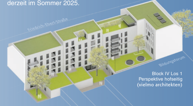
Block IV Los 1, Perspektive hofseitig (vielmo architekten)

Um für diese Bauaufgabe eine architektonisch anspruchsvolle Lösung zu entwickeln, die kulturellen, sozialen, ökologischen und nachhaltigen Anforderungen gerecht wird, hat die ProPotsdam den Realisierungswettbewerb „Vier Häuser an der Friedrich-Ebert-Straße im Block IV Potsdamer Mitte“ ausgeschrieben. Insgesamt wurden zwölf Arbeiten eingereicht und von einer Fachjury bewertet. Die Preisgerichtssitzung fand am 5. Mai 2023 statt. Der Siegerentwurf stammt vom Berliner Büro vielmo architekten, welches nunmehr die Hochbauplanung erarbeitet. Ein Bauantrag soll 2024 eingereicht werden. Mit einem Baustart rechnet die ProPotsdam derzeit im Sommer 2025.