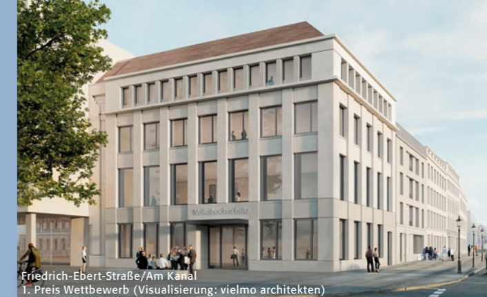
Friedrich-Ebert-Straße/Am Kanal, 1. Preis Wettbewerb (Visualisierung: vielmo architekten)