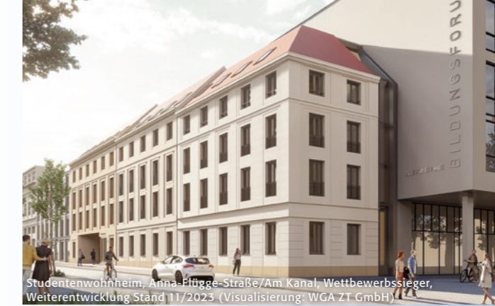
Studentenwohnheim, Anna-Flügge-Straße/Am Kanal, Wettbewerbsieger, Weiterentwicklung Stand 11/2023 (Visualisierung: WGA ZT GmbH)

1:00 m Kartengrundlagen: Potsdam-Stadtkarten M 1:600 Einzelprojekt-Pläne der Architekten, historische Linien nach Dt. Städteatlas/Potsdam Tafel 3 Karte/Montage/Zeichnung: A. Stadler © 2024 Sanierungsträger Potsdam GmbH