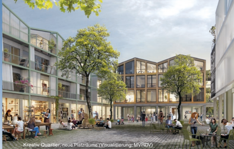
Kreativ Quartier, neue Platzräume (Visualisierung: MVRDV)

Die Kulturschaffenden haben den bestehenden Standort Rechenzentrum etabliert und fordern den Erhalt. Im Juni 2020 wurde durch Beschluss der Stadtverordnetenversammlung ein vier Phasen umfassendes Verfahren gestartet, um ein inhaltliches und gestalterisches Konzept für den Bereich des ehemaligen Kirchenschiffs der Garnisonkirche und des Rechenzentrums zu erarbeiten. 2021 wurde ein inhaltliches Konzept für die Umsetzung eines „Forums an der Plantage“ erarbeitet, welches den wiedererrichteten Kirchturm, den Standort des ehemaligen Kirchenschiffs als „Haus der Demokratie“ und einen weitgehenden oder vollständigen Erhalt des Rechenzentrums als soziokreatives und gemeinwohlorientiertes Zentrum einbezieht.