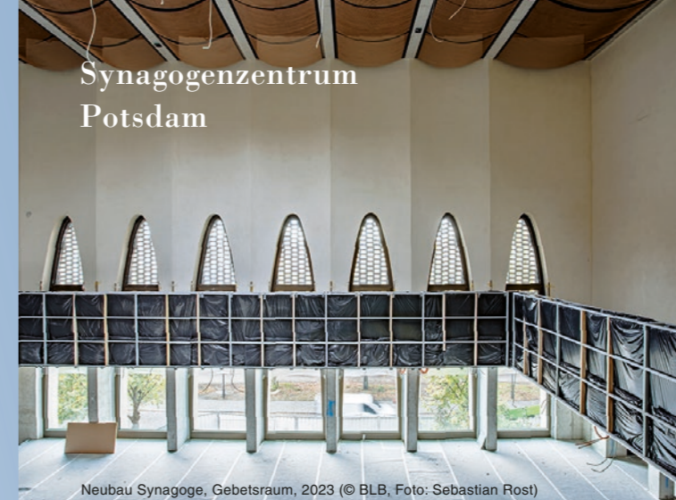
Neubau Synagoge, Gebetsraum, 2023

Nach der Zerstörung im Zweiten Weltkrieg durch die Nationalsozialisten und den späteren Abriss der Potsdamer Synagoge am heutigen Platz der Einheit fand jüdisches Leben sehr lange nicht öffentlich statt. Mit dem neuen Haus können jüdische Gemeinden nun ihre teils Jahrzehnte andauernden Provisorien verlassen.