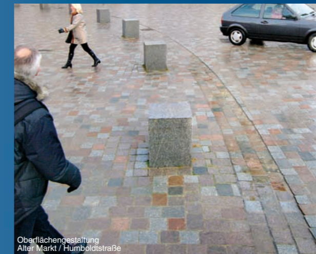
Oberflächengestaltung Alter Markt / Humboldtstraße

Die Anforderungen an die neugestalteten Flächen sind hoch: Sie müssen sich in das historische Stadtbild einfügen, bequem für flanierende Fußgänger und sportliche Radfahrer sein und zugleich den Belastungen durch schwere Fahrzeuge standhalten. Durch die Einheitlichkeit der Materialien und Maße können die Straßen und Platzfolgen rund um den Alten Markt, den Lustgarten, den Steubenplatz bis zum Neuen Markt als städtebauliches Ensemble wahrgenommen werden.