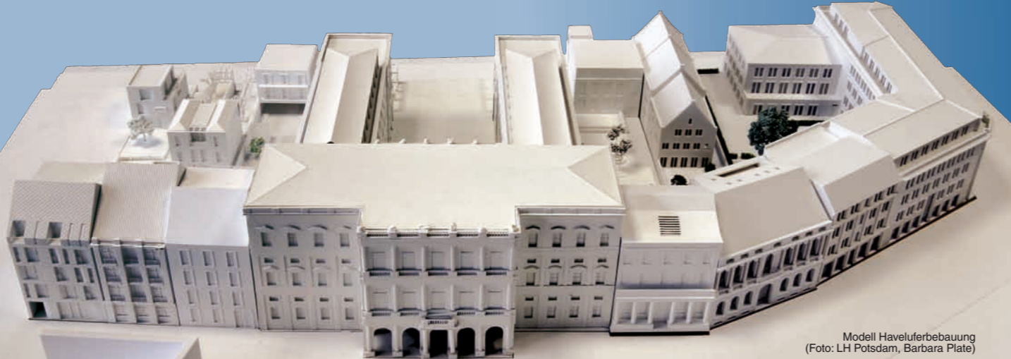
Modell Haveluferbebauung

Eine Machbarkeitsstudie hat erste Ideen zur Gestaltung geliefert. Zur Sicherung der qualitativvollen Gestaltung wird im 1. Halbjahr 2012 ein landschaftsplanerischer Realisierungswettbewerb durchgeführt. Aufgabe des Wettbewerbs ist die Schaffung einer repräsentativen, öffentlich zugänglichen Uferpromenade als Verbindung der privaten Grundstücke und der Alten Fahrt. Zwei Funktionen muss die Promenade künftig erfüllen: Zum einen dient sie als Verbindungsweg zwischen dem Wohngebiet Potsdam Süd und der Langen Brücke für Fußgänger und Radfahrer, zum anderen ist sie ein Ort der Erholung und des Aufenthalts für Flaneure.