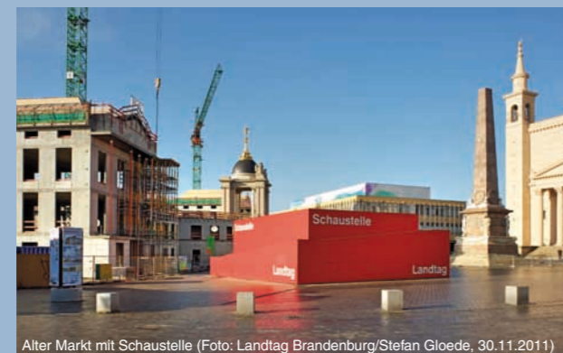
Alter Markt mit Schaustelle

Auf einer Zeitwand wird die städtebauliche Entwicklung von der Zerstörung des Stadtschlösses im Zweiten Weltkrieg bis zur Realisierung des Neubaus schlaglichtartig mit kurzen Texten, großflächigen Bildern und teilweise erstmalig veröffentlichten Fotos und Exponaten dargestellt. Drei Hörstationen lassen in den persönlichen Erinnerungen von Zeitzeuginnen und Zeitzeugen die historischen Ereignisse lebendig werden. Die künftige Nutzung des Neubaus als Parlament steht auf der Politikwand im Fokus. Veränderungen auf der Baustelle können mittels einer Fotodokumentation nachverfolgt werden. Zusätzlich bietet die großzügige Aussichtsplattform auf dem Dach der Infobox Informationen zu den Gebäuden rund um den historischen Alten Markt. Die durchgängig in deutscher und englischer Sprache gestaltete Ausstellung sowie die Aussichtsplattform sind täglich von 10 bis 18 Uhr geöffnet. Der Besuch ist kostenfrei.