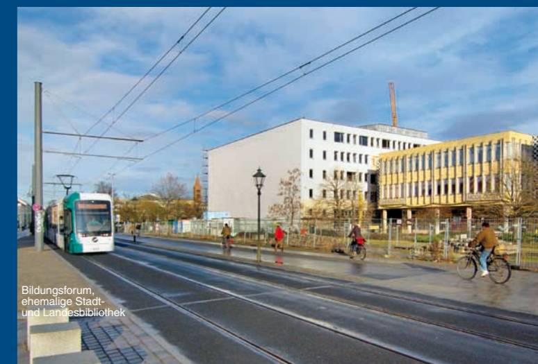
Bildungsforum, ehemalige Stadt- und Landesbibliothek