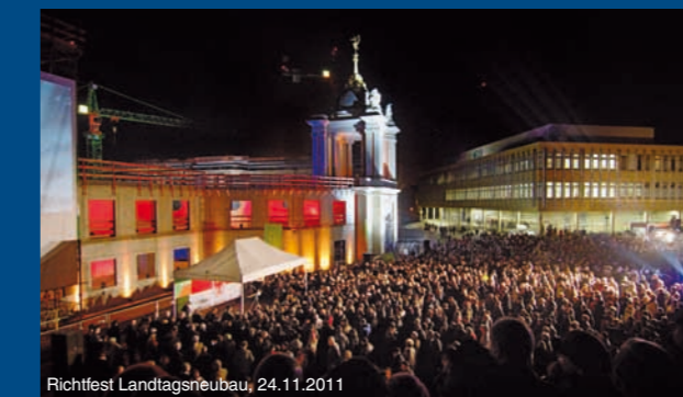
Richtfest Landtagsneubau, 24.11.2011

Die Umsetzung des Projektes erfolgt in öffentlich-privater Partnerschaft. Planung, Errichtung, Finanzierung und Betrieb des Gebäudes liegen über einen Zeitraum von 30 Jahren in den Händen eines privaten Partners, der BAM PPP Landtag Potsdam Projektgesellschaft mbH, die gemeinsam mit dem Land Brandenburg als Bauherr auftritt. Die Baukosten betragen ca. 120 Mio. Euro, darin enthalten ist eine Spende des SAP-Gründers Hasso Plattner in Höhe von 20 Millionen Euro für die Rekonstruktion der historischen Fassaden. Hinzu kommt eine weitere Spende des Mäzens zur Finanzierung der Ausführung des Daches mit einer Eindeckung aus Kupfer.