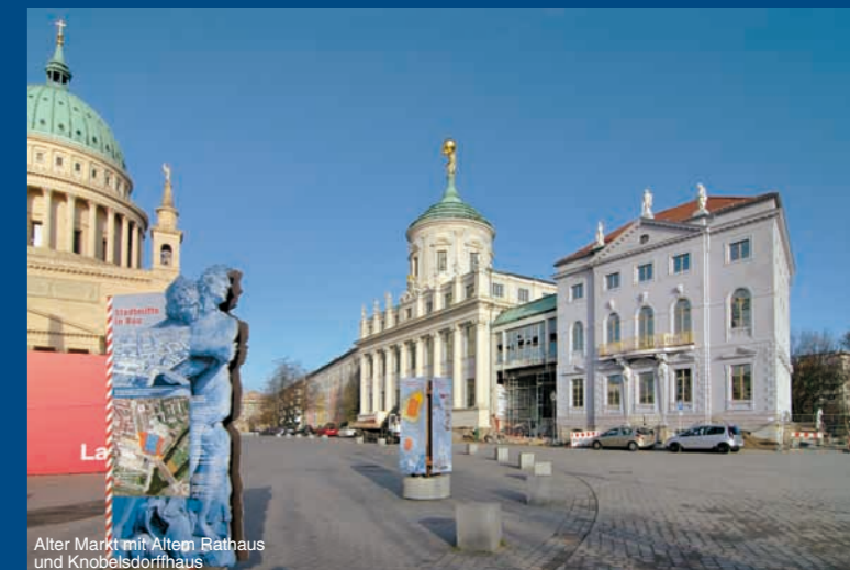
Alter Markt mit Altem Rathaus und Knobelsdorffhaus