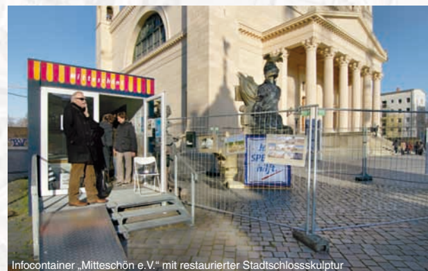
Infocontainer „Mittschön e.V.“ mit restaurierter Stadtschlössskulptur