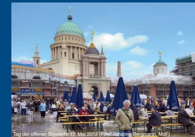
Tag der offenen Baustelle 12. Mai 2012

Die Umsetzung des Projektes erfolgt in öffentlich-privater Partnerschaft. Planung, Errichtung, Finanzierung und Betrieb des Gebäudes liegen über einen Zeitraum von dreißig Jahren in den Händen eines privaten Partners, der BAM PPP Landtag Potsdam Projektgesellschaft mbH. Die Baukosten betragen ca. 120 Millionen Euro, darin enthalten ist eine Spende des SAP-Gründers Hasso Plattner in Höhe von 20 Millionen Euro für die Rekonstruktion der historischen Fassaden. Hinzu kommt eine weitere Spende des Mäzens zur Finanzierung der Ausführung des Daches mit einer Eindeckung aus Kupfer.