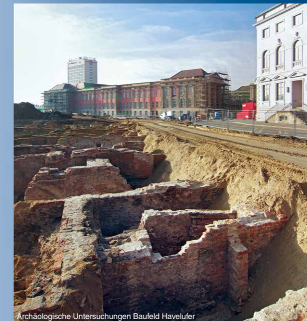
Archäologische Untersuchungen Baufeld Havelufer

Die Bebauung erfolgt auf der Grundlage des Integrierten Leitbautenkonzeptes und dem Ergebnis eines zweistufigen Bieterverfahrens. Zur Sicherung der Bauqualität wird die Realisierung der Bauvorhaben von einer Arbeitsgruppe, u.a. bestehend aus Denkmalpflegern und externen Fachleuten begleitet. Der Uferbereich soll als öffentliche Promenade gestaltet werden, hierfür wird 2013 ein landschaftsplanerischer Realisierungswettbewerb durchgeführt. Die Realisierung des Wettbewerbsergebnisses soll voraussichtlich 2015 nach Fertigstellung der Haveluferbebauung erfolgen.