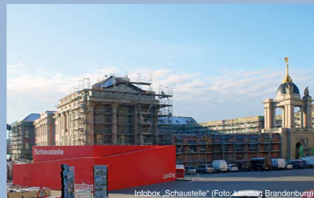
Infobox „Schaustelle“

Auf einer Zeitwand wird die städtebauliche Entwicklung von der Zerstörung des Stadtschlusses im Zweiten Weltkrieg bis zur Realisierung des Neubaus schlaglichtartig mit kurzen Texten, großflächigen Bildern und teilweise erstmalig veröffentlichten Fotos und Exponaten dargestellt. Drei Hörstationen lassen in den persönlichen Erinnerungen von Zeitzeuginnen und Zeitzeugen die historischen Ereignisse lebendig werden. Die künftige Nutzung des Neubaus als Parlament steht auf der Politikwand im Fokus. Veränderungen auf der Baustelle können mittels einer Fotodokumentation nachverfolgt werden. Zusätzlich bietet die großzügige Aussichtsplattform auf dem Dach der Infobox Informationen zu den Gebäuden rund um den historischen Alten Markt. Die durchgängig in deutscher und englischer Sprache gestaltete Ausstellung sowie die Aussichtsplattform sind täglich von 10 bis 18 Uhr geöffnet. Der Besuch ist kostenfrei.