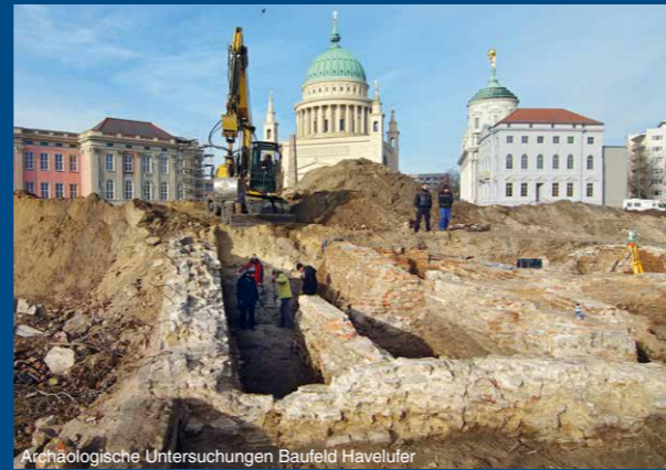
Archäologische Untersuchungen Baufeld Havelufer

Die neugestalteten Flächen fügen sich in das historische Stadtbild ein, sind komfortabel für flanierende Fußgänger aber auch sportliche Radfahrer und halten zugleich den Belastungen durch schwere Fahrzeuge stand. Durch die Einheitlichkeit der Materialien und Maße bilden die Straßen und Platzfolgen rund um den Alten Markt, den Lustgarten, den Steubenplatz bis zum Neuen Markt ein städtebauliches Ensemble.