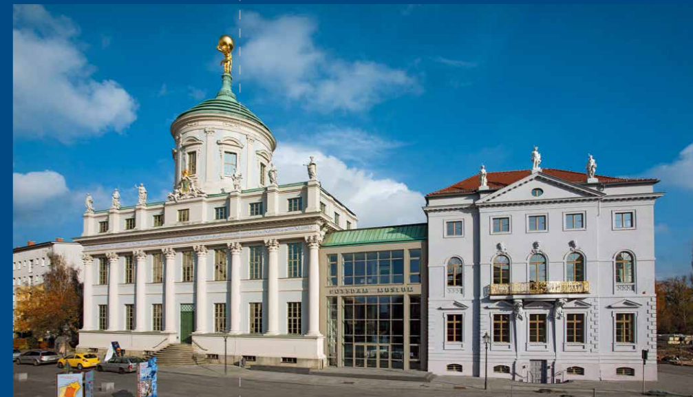
Altes Rathaus und Knobelsdorffhaus

Im Herbst 2013 wird die ständige stadthistorische Ausstellung Potsdams eröffnet. Auf insgesamt 700 m 2 ist dann die mehr als 1000-jährige Stadtgeschichte in elf Themenmodulen dargestellt. Die bekannten Räume werden in einer völlig neuen Art und Weise erlebbar sein.