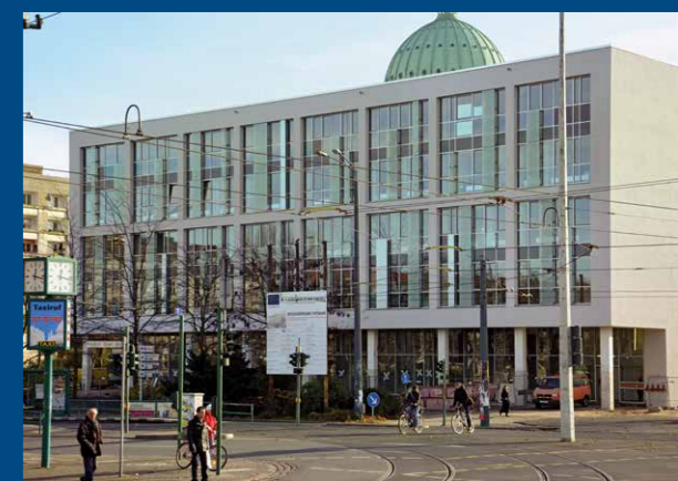
Bildungsforum, ehemalige Stadt- und Landesbibliothek

Für die Planung und Umsetzung des Bildungsforums war eine möglichst hohe Aufenthaltsqualität und die Entwicklung eines optimalen Raumkonzeptes zum Lernen von besonderer Bedeutung. Das Haus ist barrierefrei, was sich nicht nur auf die ganz praktische Zugänglichkeit bezieht, sondern vor allem auf den Zugang zu Bildung und Wissen für alle Potsdamer Bürger und ihre Gäste. Die drei Einrichtungen bereiten schon jetzt Programmbereitschaften vor, die es bisher noch nicht gegeben hat. Der Weg zum Bildungsforum lohnt sich also mehrfach.